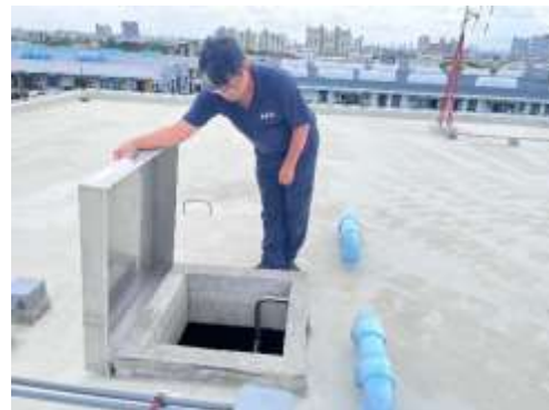
รูปที่ 18 ถังสำรองน้ำและเจ้าหน้าที่ทำความสะอาด