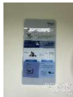
รูปที่ 23 อุปกรณ์ประจำสระว่ายน้ำและวิธีการช่วยชีวิตเมื่อมีคนจมน้ำ