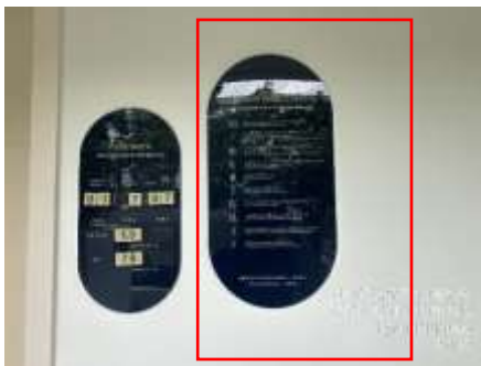
รูปที่ 21 ป้ายกฎระเบียบการใช้สระว่ายน้ำ