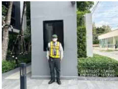
รูปที่ 6 เจ้าหน้าที่รักษาความปลอดภัย