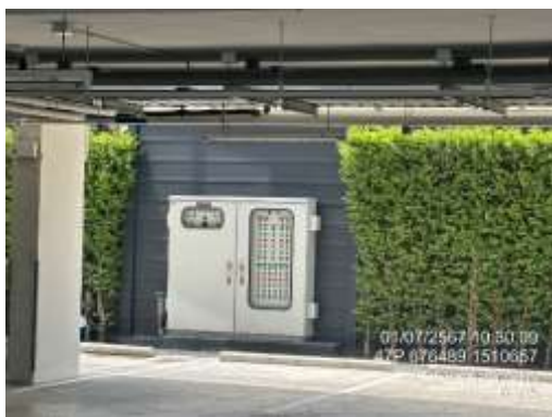
รูปที่ 35 มิเตอร์น้ำเสีย