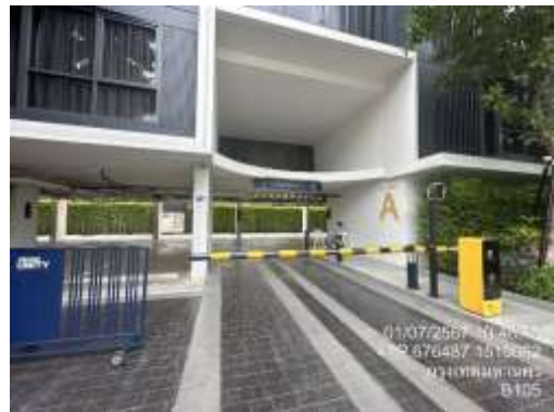
รูปที่ 34 ไม้กั้นทางเข้า-ออกโครงการ