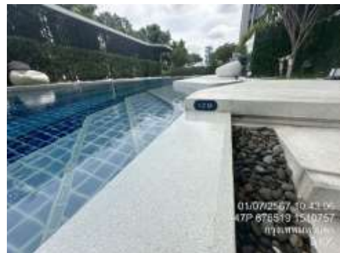
รูปที่ 19 สระว่ายน้ำ