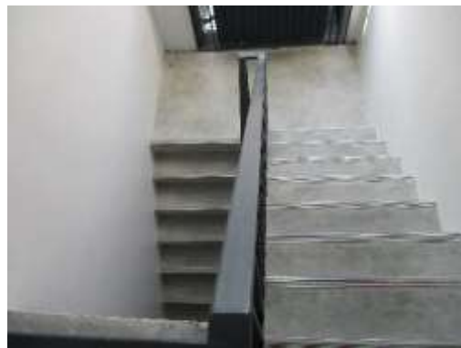
รูปที่ 13 บันไดหนีไฟ