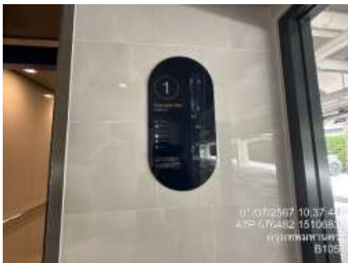
รูปที่ 12 แผนผังหนีไฟ