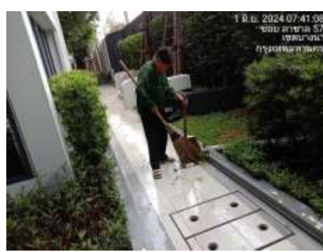
รูปที่ 2 เจ้าหน้าที่ดูแลพื้นที่สีเขียว