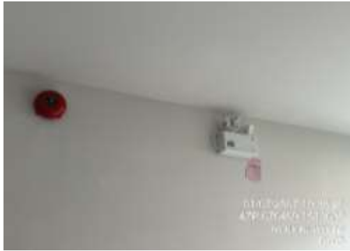
รูปที่ 14 ไฟฟ้าฉุกเฉิน