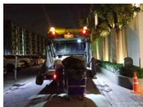
รูปที่ 8 รถขยะเข้ามาเก็บขยะมูลฝอยภายในโครงการ