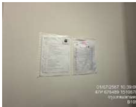
รูปที่ 9 ห้องพักขยะและท่อรวบรวมน้ำเสีย