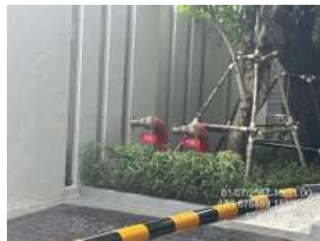
รูปที่ 7 หั้วรับน้ำดับเพลิง