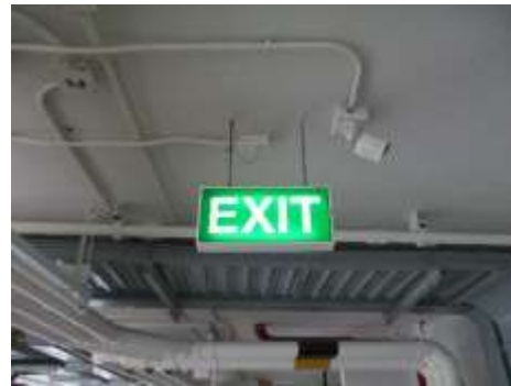
รูปที่ 10 ระบบป้องกันอัคคีภัย (ต่อ)