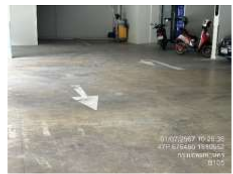
รูปที่ 4 ป้ายบอกเส้นทางการจราจรภายในโครงการ