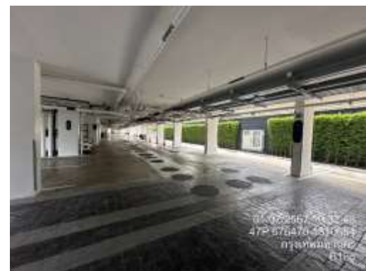
รูปที่ 32 พื้นที่จอดรถภายในโครงการ