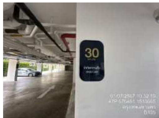
รูปที่ 28 ป้ายจำกัดความเร็ว