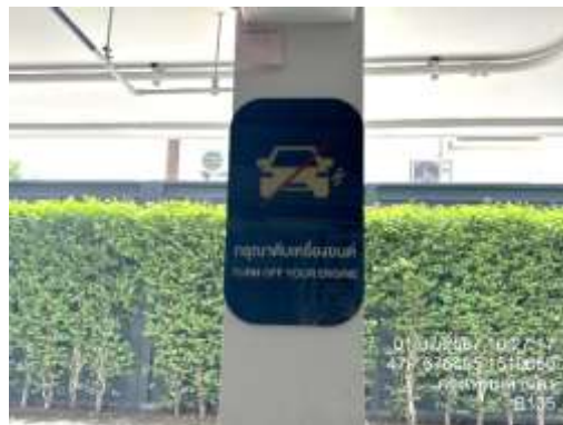
รูปที่ 29 ป้ายกรณาดับเครื่องยนต์