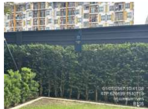
รูปที่ 1 พื้นที่สีเขียว