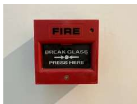
รูปที่ 10 ระบบป้องกันอัคคีภัย