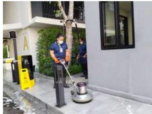
รูปที่ 31 เจ้าหน้าที่ทำความสะอาดพื้นถนนภายในโครงการ