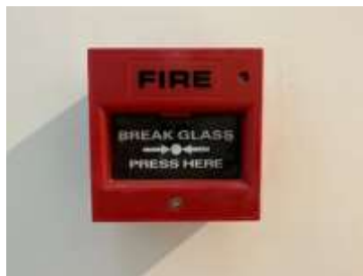
รูปที่ 11 ระบบแจ้งเตือนอัคคีภัย