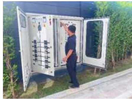
รูปที่ 30 เจ้าหน้าที่ดูแลระบบบำบัดน้ำเสียของโครงการ