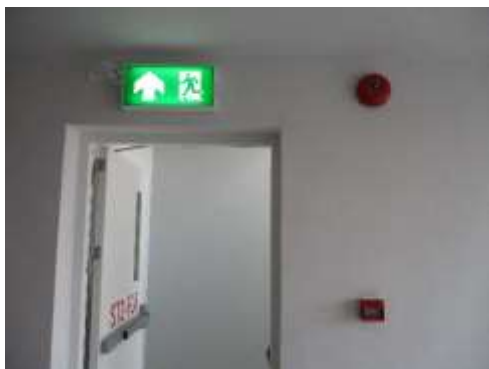
รูปที่ 37 ประตูหนีไฟ