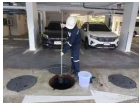
รูปที่ 5 เจ้าหน้าที่ตรวจสอบคุณภาพน้ำ