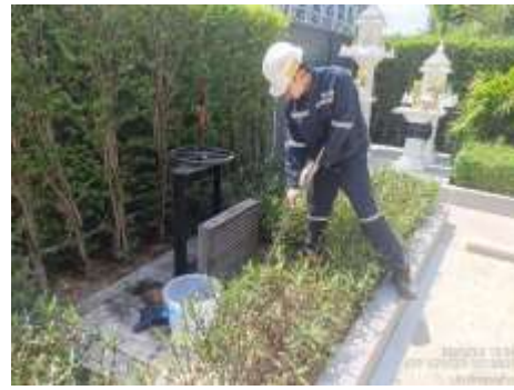
รูปที่ 5 เจ้าหน้าที่ตรวจสอบคุณภาพน้ำ (ต่อ)