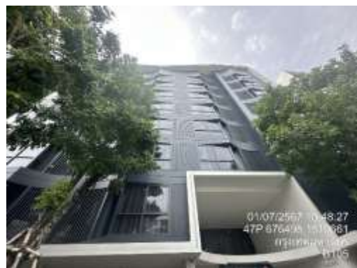
รูปที่ 36 ลีอาคาร (อ่อน)