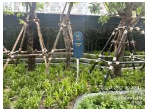
รูปที่ 16 จุดรวมพล