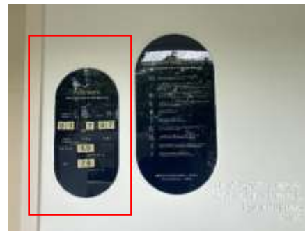
รูปที่ 22 ป้ายค่าน้ำมาตรฐาน