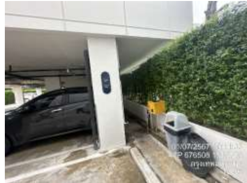
รูปที่ 26 พื้นที่สูบบุหรี่