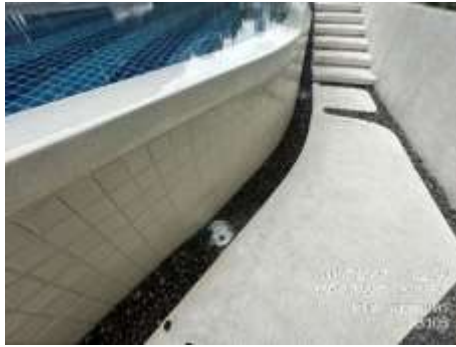
รูปที่ 20 รางระบายน้ำล้นสระว่ายน้ำ