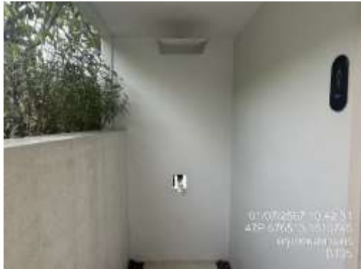
รูปที่ 25 พื้นที่สำหรับชำระร่างกาย