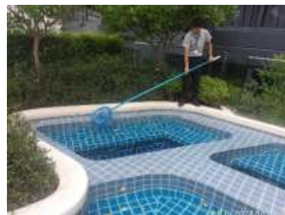
รูปที่ 24 เจ้าหน้าที่ทำความสะอาดสระว่ายน้ำ