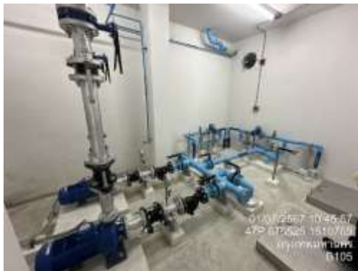
รูปที่ 17 เครื่องปั้มน้ำ