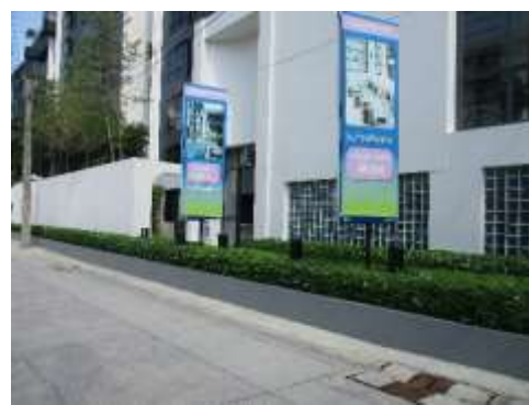
รูปที่ 38 ไฟส่องสว่างภายในโครงการ