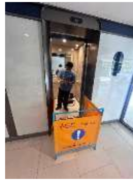
รูปที่ 39 ตรวจเช็คลิฟต์