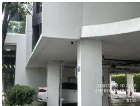
รูปที่ 27 กล้องวงจรปิด (cctv)