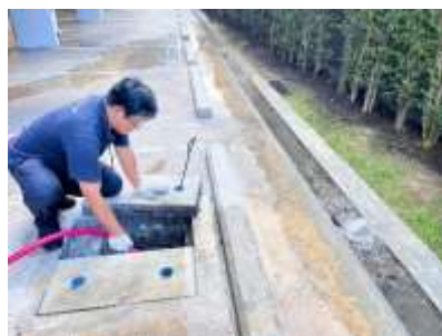
รูปที่ 40 ลอกท่อภายในโครงการ