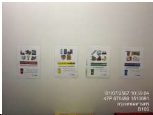
รูปที่ 15 ป้ายรณรงค์การแยกขยะ