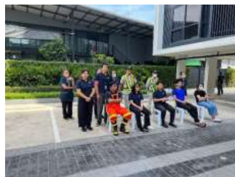
รูปที่ 41 ซ่อมดับเพลิง